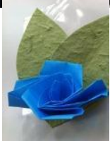
←第9回では 折り紙アートを 作りました！！