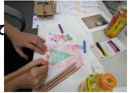
↑第5回では Xmas カード を作りました！！

その中でも大人気の「カラーアート手話交流会」。毎回満員御礼にて開催！！ 今回は、定員人数を増やし拡大版にて開催いたします 手話が初めての方も、ろう者のからも手話教室の講師がおりますので安心して 参加できます。カラーやアートという共通のツールを使ってコミュニケーション を深める、当協会独自の手話交流会です。